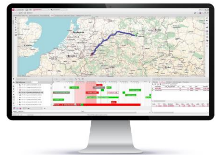
C-Logistic: Grafische Disposition