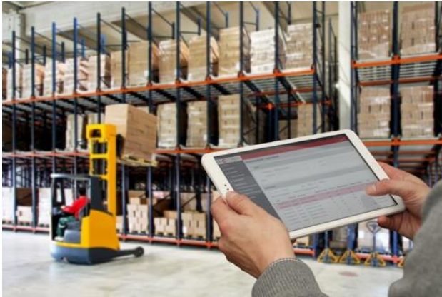
Webbasiertes Auskunftportal C-Info

Texte und Bilder stehen für eine Presseberichterstattung über die C-Informationssysteme GmbH honorarfrei zur Verfügung.